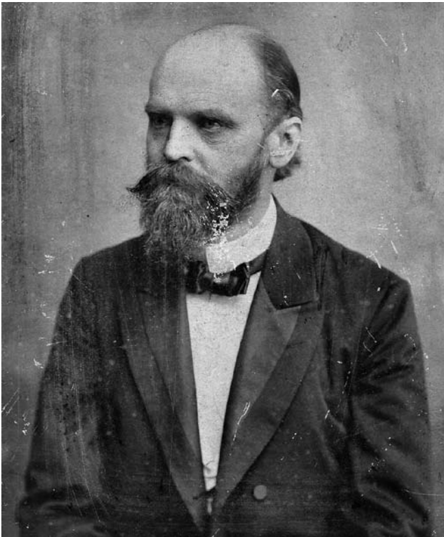
Ferdinand Tönnies (1905).

Erste allgemeine Einblicke in Ferdinand Tönnies' spezifische Kritik der Moderne, die gerade nicht in einen Traditionalismus zurückfällt, gaben nach Tönnies' Tod 1936 und dem „Grabgesang“ anlässlich seines 100. Geburtstages 1955 erst wieder zwischen 1980 und 1987 drei internationale Tönnies-Symposien in Kiel. Sie zeigten auch, dass kaum Gelegenheit besteht, seine heute aktuell werdenden Texte vor dem Hintergrund eines gesicherten und präsenten Ceuvres zu lesen. Mitte der achtziger Jahre begannen deshalb erste Bestrebungen, die Tönnies-Forschung zu institutionalisieren, als die Ferdinand-Tönnies-Gesellschaft e.V. in Kiel und am Institut für Soziologie der Universität Hamburg die spätere Ferdinand-Tönnies-Arbeitsstelle sich der Erschließung und Förderung des wissenschaftlichen Werkes des Nestors der deutschen Soziologie annahm.