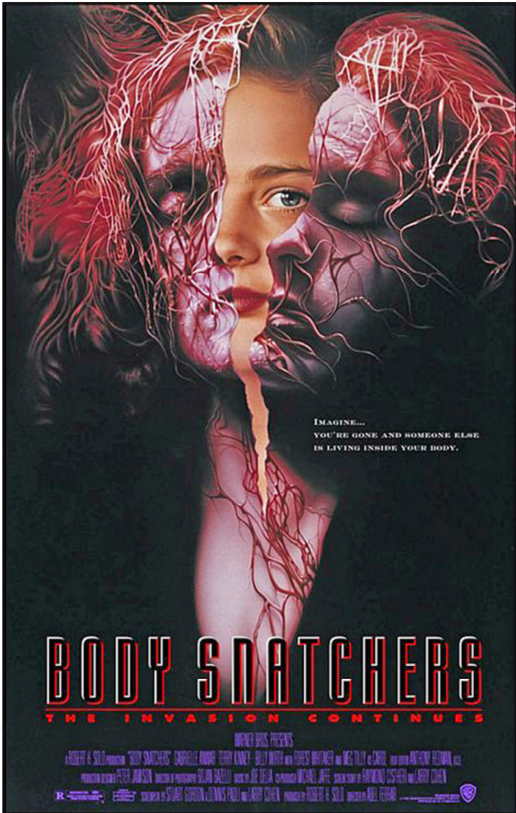
© Warner Bros. Poster design by B.D. Fox Independent