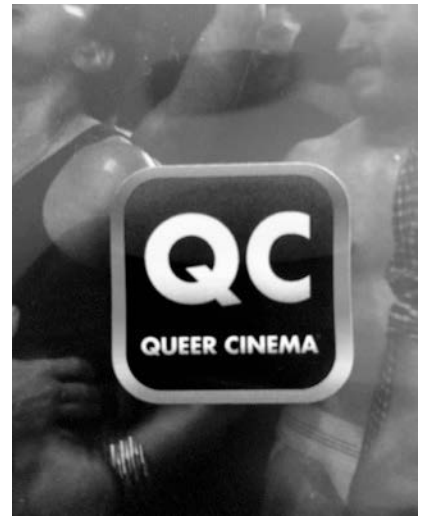
Abb. 6 DVD-Hülle von Interior. Leather Bar

Filmproduktionshistoriografie könnte bedeuten, eine lineare und zielgerichtete Entwicklung, Vorbereitung und Durchführung eines Filmprojekts nachzuzeichnen. Zentral bliebe darin der Fokus auf ein bestehendes Werk, dessen Hervorbringung, womöglich hagiografisch, rekonstruiert würde. Mit der produktionshistorischen Skizze zu Cruising ist ein alternatives Verfahren angezeigt, das auf eine epistemologische Verschiebung der Perspektive auf Film als Gegenstand deutet. Mit dem Fokus auf Produktion kann Filmgeschichte anders dargestellt werden; Produktionshistoriografie eröffnet die Möglichkeit, um mit Vonderau zu sprechen, Film als «work in progress» zu verstehen» und «die Idee eines autoritativen Originals» zu verwerfen. 38 Dass die Geschichte zu Cruising von Störungen und Eingriffen, von Zensur und Zerstörung erzählt, zeigt die Arbitrarität des Herstellungsprozesses markant auf, ist aber nur offensichtliches