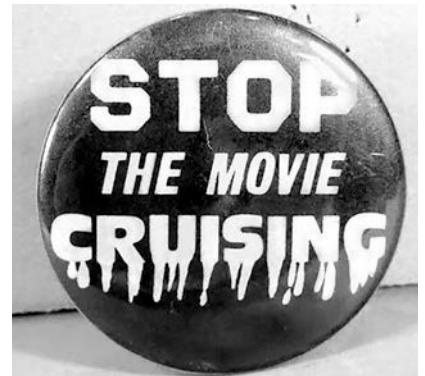
Abb. 1 Button gegen die Dreharbeiten von Cruising

Cruising fußt auf einem Roman wie auf Zeitungsberichten zu Morden in der schwulen Leder- und SM-Szene in den 1970er Jahren. Bereits die Ankündigung des Filmprojekts wurde umgehend zum Politikum. Der Journalist und Politaktivist Arthur Bell berichtete in seiner Kolumne im Magazin Village Voice mehrfach von den anstehenden und laufenden Dreharbeiten, und er rief zum Widerstand auf. 4 Raubkopien von Drehbuchfassungen