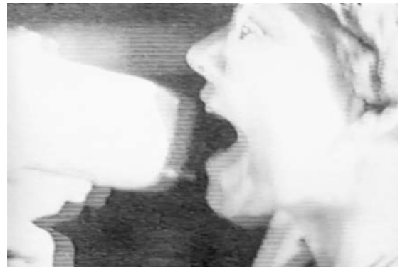
Abb. 2-3 Screenshots aus: Stop the Movie (Cruising) , Regie: Jim Hubbard, USA 1979/80

wurden heimlich Aktivist_innen zugespielt. Die auf Diskussionsveranstaltungen und Flugblättern drastisch artikulierte Kritik galt vor allem dem Fokus auf die SM-Szene. Das Filmprojekt wurde als homophob angeprangert, weil die thematische Verquickung von als deviant verhandelter Sexpraxis und mörderischer Gewalt insinuierte, dass Schwulsein eine genuin lebensbedrohliche Lebensform sei. Regisseur Friedkin wurde vorgehalten, gesellschaftliche Strukturen von Homophobie nicht zu reflektieren, sondern vielmehr zu befeuern; der New Yorker Bürgermeister wurde daher aufgefordert, die Drehgenehmigung zurückzuziehen. Eine Kritik wiederum am Protest selbst war, dass er auf Zensur hinauslaufe, weil er das Recht auf freie Meinungsäußerung und künstlerische Freiheit beschneiden wolle. Innerhalb der schwulen Community gab es Vorbehalte gegen die Protestbewegung, weil sie Sadomasochismus und Promiskuität delegitimieren wolle und damit in puritanistisches Fahrwasser gerate. 5