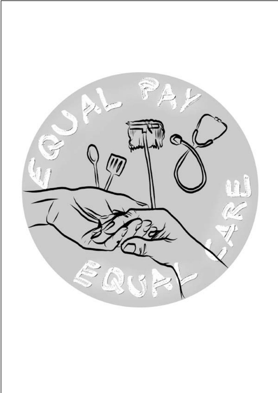
Anne Meerpohl: Coloring Quarantine Nr. 16