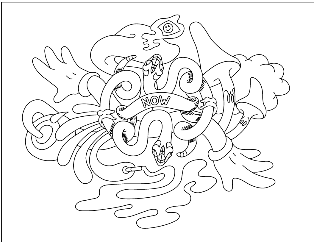
Zuzanna Czebatul: Coloring Quarantine Nr. 14

«Coloring Quarantine» ist ein Projekt der Exile Gallery (Wien) und entstand in Reaktion auf den Lockdown im Frühjahr 2020. Alle Bilder sind im Netz zugänglich und können zum Ausmalen ausgedruckt werden: exilegallery.org/exhibitions/coloring-quarantine/