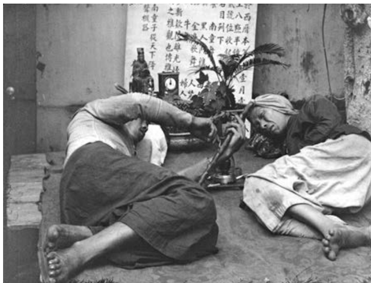
Abb. 1 Die fehlende Sichtbarkeit bestimmter Materialien betrifft auch Aktualitätensfilme. Still aus Fumerie d'opium , Regie: Gabriel Veyre, Annam (Vietnam, damaliges Indochina) 1899/1900

Eine rassismus- und machtkritische Haltung in der Lehre, im wissenschaftlichen Schreiben und auch im Miteinander der Studierenden beruht in erster Linie auf einem respektvollen, aufrichtigen <Sich-verantwortlich-Halten bzw. -Zeigen>, d. h. dem Eingeständnis eigener Versäumnisse und Fehler sowie der Arbeit an diesen, in einem Rahmen, in dem man die Möglichkeit zum eigenen Wachstum und der Revision eigener Positionen bekommt. Während Kritik im persönlichen Vier-Augen-Gespräch oft angenommen wird, fehlt hier eine