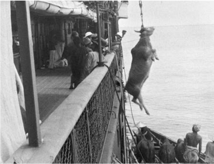
Abb. 2 Implizite Gewalt in Prozessen der Visualisierung. Still aus Embarquement d'un boeuf à bord d'un navire , Regie: Gabriel Veyre, Tonkin (Vietnam, damaliges Indochina) 1899/1900

Transparenz nach außen, die den institutionellen Kern diagnostizierbar macht. Nach außen hin erscheint die Universität als Blackbox mit <weißer Weste> – ein Bild, das aus universitärer Perspektive verständlicherweise beibehalten werden soll. 6 Negative Erfahrungen in der Mikrodimension der konkreten Lehre und Forschung für die Öffentlichkeit sicht- und somit adressierbar zu machen, hat für den öffentlichen Diskurs großen Wert, bringt aber Probleme mit sich: Es ist davon auszugehen, dass sich die betroffene Person in den anonymisierten Schilderungen wieder-