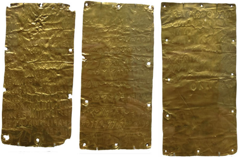
Abb. 2: Drei Goldbleche mit Weihungen in phönizischer und etruskischer Sprache an Astarte, aus dem Tempel B von Pyrgi, um 500 v. Chr.

standen symbolisch für Sonne (Gold) und Mond (Silber). Dementsprechend kommen diese Materialien häufig im Zusammenhang mit Texten vor, die von königlicher Seite in Auftrag gegeben wurden. Als Beispiel seien die phönizischen und etruskischen Goldtafeln aus Pyrgi (ca. 500 v. Chr.) genannt, auf denen königliche Gaben an Astarte festgehalten sind (Abb. 2), und zwei beschriftete Goldtafeln aus Hamadan, die typisch achaimenidische Machtrepräsentationen tragen und angeblich aus der Zeit von Ariararnes und Arsames, dem Urgroßvater und Großvater von Darius I., stammen. Wahrscheinlich aber wurden beide erst unter Darius I. hergestellt, um seine Herrschaft zu legitimieren; für diesen Zweck stellte Gold als Beschreibmaterial ein besonders geeignetes symbolisches Mittel dar. 3 Wenn ptolemäische Könige in Ägypten – wie im Fall des von Ptolemaios III. Euergetes in Alexandrien gegründeten Serapistempels (SEG 54.1723) – Gold- und Silbertafeln mit Gründungsurkunden von wichtigen Tempeln beschriften lassen, dann rührt diese Praxis von der Bewertung von Gold und Silber als Stoffe von und für Könige und Götter her.