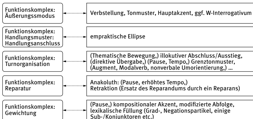
Abb. 1.3: Funktionskomplexe und sprachliche Mittel der Mündlichkeit.

Nicht ↓, als Bestellung Pommes Rot-Weiß ↓. Der Ort einer Handlung kann mit hier ↓, die Richtung einer Bewegung mit hierher ↓ sprachlich minimal gezeigt werden, die Realisierungsweise mit la:ngsam ↓, das betroffene Objekt mit den Brief ↓, das Skalpell ↓ etc.