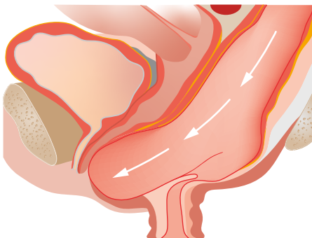
Abb. 18.1: Rektozele (das Rektum und die Vagina prolabieren nach ventral).