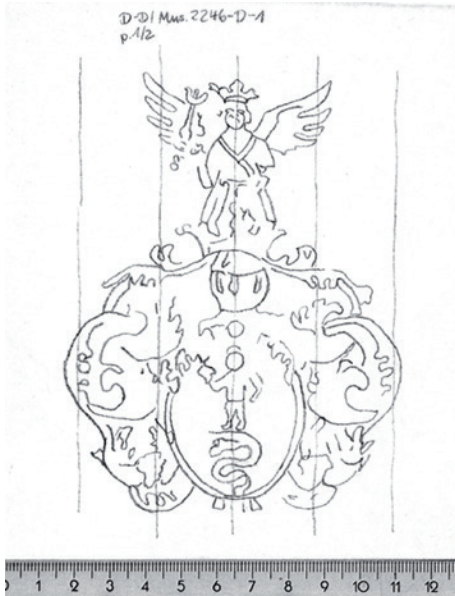
Abb. 4: Wasserzeichen-Durchzeichnung mit als Maßstab beigefügtem Lineal.

Die für die Digitalisierung eingesetzten Geräte sind der „Proserv“ und der „Grazer Buchtisch“. Auf Letzterem werden die meisten gebundenen Noten sowie empfindliche Materialien, die ein Aufklappen auf 180° schädigen könnte, gescannt, auf dem Proserv dagegen Stimmenmaterialien und flach aufklappbare Noten. 12 Die Gesamtanzahl der gescannten Seiten wird bei Projektende vorraussichtlich bei ca. 240.000 Aufnahmen liegen. 13 Über die Digitalisierung von Vorder- bis Hinterdeckel hinaus werden für das Projekt auch die philologisch interessanten Buchrücken der Originaleinbände aufgenommen.