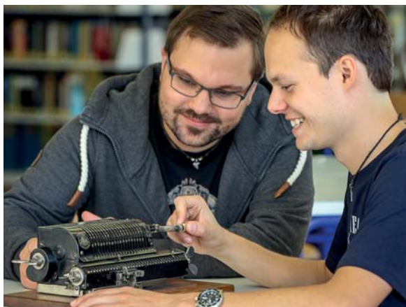
Brunsviga Sprossenradmaschine (Modell „Trinks Triplex“) von 1917

Schwerpunkten für alle Studierenden des Fachbereichs angeboten wird. Ziel ist es, die Studierenden mit den Exponaten der Sammlung vertraut zu machen und die Schätze, die darin schlummern, zu entdecken. Jede Gruppe sucht sich ein Modell oder Exponat aus der Sammlung aus. Dann ist Fantasie gefragt: Jede Gruppe überlegt sich, wie man das Exponat und die fachlichen Sachverhalte, die es erläutert, den Kommilitonen näherbringen kann. Erlaubt ist alles, nur nicht 90 Minuten ohne Pause zu reden!