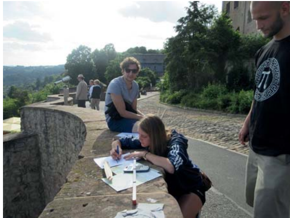
Auf der Mathematischen Stadtführung, durchgeführt im Rahmen der „MINT Summer School“