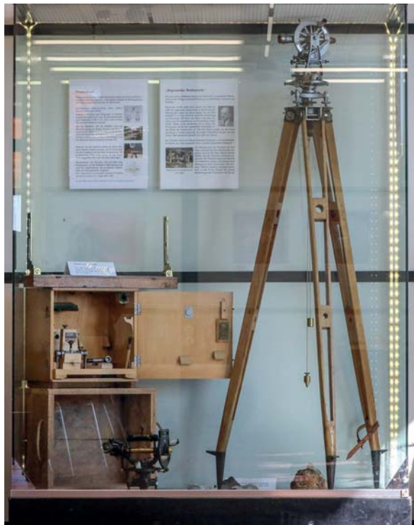
Eine der Vitrinen in der Bibliothek

In Zeiten knapper Kassen stellt sich für jede wissenschaftliche Sammlung die Frage, welche Funktion sie erfüllen soll, da doch die Hauptaufgaben der Universitäten Forschung und Lehre sind, nicht der Bau und Unterhalt von Museen. Offensichtlich hängt von der Beantwortung