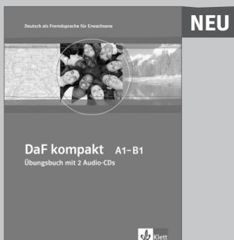
DaF kompakt A1–B1 Übungsbuch mit 2 Audio-CDs 978-3-12-676181-9