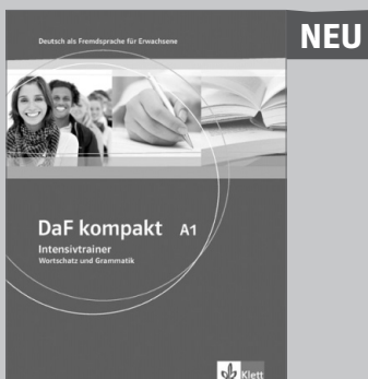
DaF kompakt A1 Intensivtrainer 978-3-12-676183-3

Diese Titel erhalten Sie in Ihrer Buchhandlung oder im Internet unter www.klett.de/dafkompakt