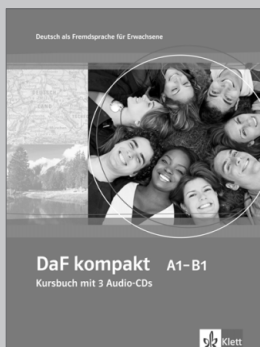
DaF kompakt A1–B1 Kursbuch mit 3 Audio-CDs 978-3-12-676180-2