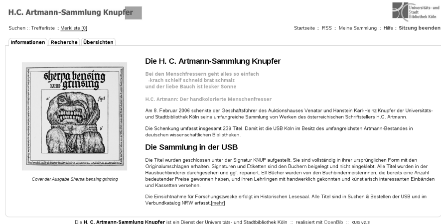
Abbildung 25: Die H. C. Artmann-Sammlung Knupfer als Beispiel für ein eigenständiges Portal in der KUG-Plattform

Neben der Fähigkeit getrennte Portale einzurichten stellt die KUG-Plattform viele ihrer Funktionen auch durch eigene offene Schnittstellen – den sog. Konnektoren – für eine externe Nutzung bereit. Dies geschieht im Allgemeinen in Form von Web Services. Damit lassen sich Konnektoren ideal zum Aufbau serviceorientierter Infrastrukturen auf Basis des KUG nutzen.