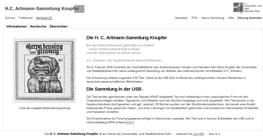
Abbildung 25: Die H. C. Artmann-Sammlung Knupfer als Beispiel für ein eigenständiges Portal in der KUG-Plattform

Neben der Fähigkeit getrennte Portale einzurichten stellt die KUG-Plattform viele ihrer Funktionen auch durch eigene offene Schnittstellen – den sog. Konnektoren - für eine externe Nutzung bereit. Dies geschieht im Allgemeinen in Form von Web Services. Damit lassen sich Konnektoren ideal zum Aufbau serviceorientierter Infrastrukturen auf Basis des KUG nutzen.