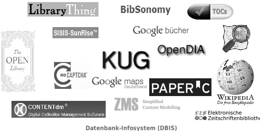
Abbildung 22: Konsequente Nutzung externer Dienste im KUG

Dieser überprüft – ebenfalls über eine einfache Recherche – die Verfügbarkeit von Informationen über den aktuellen Titel im entfernten System. Existieren Informationen zum aktuellen Titel, so wird ein geeignetes Status-Bild per internem Redirect ausgegeben und der Recherche-Link ist nutzbar. Im anderen Fall wird stattdessen ein transparenter Pixel ausgegeben und der Link ist unsichtbar. Dieses sehr einfache Verfahren hat sich insbesondere in den Fällen bewährt, wenn gerade (noch) kein API vorhanden ist, wie es z.B. bis März 2010 beim „Internet-Copy-Shop“ PaperC der Fall war. Insgesamt hat sich jedoch der Einsatz von APIs durchgesetzt.