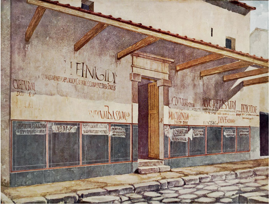
Abb. 1: Pompeji, Fassade der Casa di Trebio Valente (III 2, 1) – Rekonstruktionszeichnung mit Wiedergabe der 1915 noch erhaltenen Aufschriften (aus Spinazzola 1953, Taf. IX).

im Norden immerhin fünf Empfehlungen entlang des Vicolo dei Vettii überliefert. 21 Diese enge Straße stellte den direkten Weg vom Stadttor zum Forum Pompejis und dem dort gelegenen Macellum dar und dürfte folglich stark frequentiert gewesen sein. Darüber hinaus ist erkennbar, dass der Name des Trebius den Zeitgenossen insbesondere entlang der Hauptstraßen begegnete, ein Merkmal, das auch für andere Kandidaten gilt. Es zeichnet sich jedoch eine deutliche Konzentration in unmittelbarer Nachbarschaft seines Wohnhauses ab. Dem aufmerksamen Nutzer der Via dell'Abbondanza, einer basarähnlichen Einkaufsstraße, konnte der Name auf einem etwa 400 m langen Abschnitt 24 Mal ins Auge springen. Leider lässt sich nicht mehr feststellen, ob dies auch entlang der anderen Hauptstraßen so gewesen ist. Es fällt aber auf, dass aus den städtischen Zentren, dem Forum, den Heiligtümern und ihren Zugängen sowie dem Amphitheater nur vereinzelte Beispiele solcher Wahlwerbungen bekannt sind. Die Konzentration von programmata in der Nähe des Wohn-