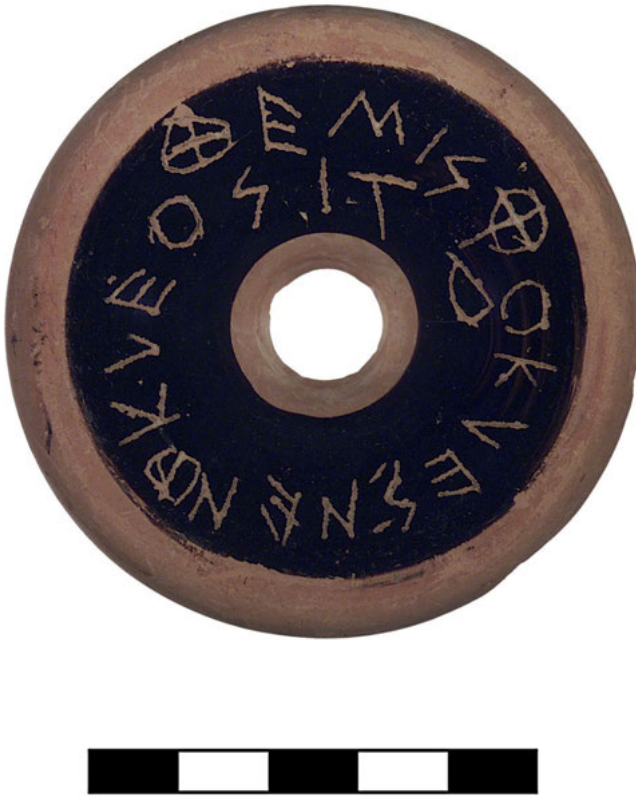
Abb. 3: Ostrakon von Themistokles Neokleos, gefunden in der Agora von Athen.

Bewahrerinnen der Familientradition. 10 Auch Orakelbefragungen konnten auf diese Art und Weise schriftlich fixiert werden (→Metall, Fallbeispiel mit Abb. 4). 11