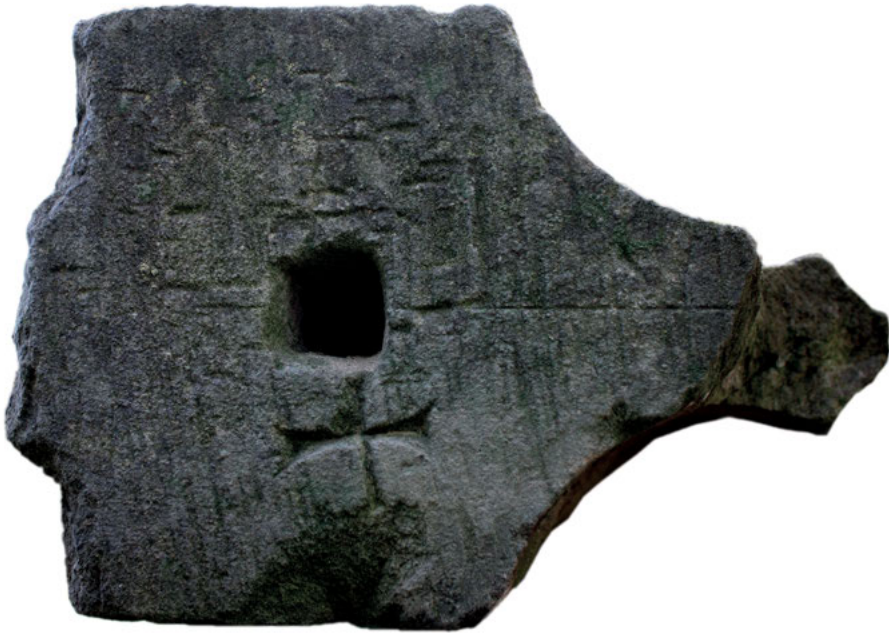
Abb. 4: Klosterruine Disibodenberg, Gewölberippe mit Mittenritzlinie, Zapfenloch und Versatzzeichen in Kreuzform.