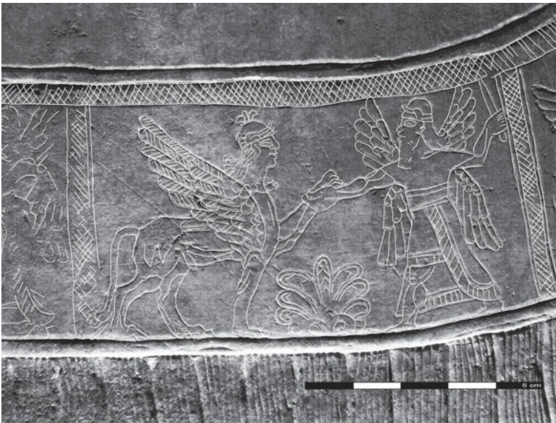
Abb. 2: Ritztechnik an neuassyrischen Palastreliefs. Oben: Geritzte Verzierung des Gewandes eines geflügelten Genius. Nordwestpalast in Kalḫu (Nimrud), 9. Jahrhundert v. Chr. (© The Trustees of the British Museum, BM 124565 [Detail]). Unten: Geritzter Gewandsaum des Königs Assurnasirpal II. auf dem Orthostat BM 12.45.67 aus Kalḫu (Nimrud), 9. Jahrhundert v. Chr. (© The Trustees of the British Museum, BM 12.45.67 [Detail]).