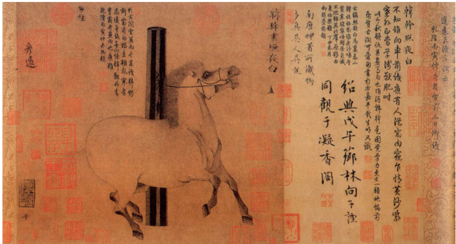
Abb. 4: Besitzersiegelstempel auf einem Tushegemälde von Han Gan, 8. Jahrhundert (heute im Metropolitan Museum, New York).

Mit dem Wechsel der Schrifträger bzw. des Beschreibstoffes von Holz und Bambus zu Papier im 3. und 4. Jahrhundert wurden die chinesischen Typare, die hauptsächlich Lehmsiegel produziert hatten, zunehmend als Stempel für „Farbsiegel“ auf glatter, saugfähiger Unterlage eingesetzt (diese Technik begegnet früh auf Seide). Kunstgeschichtlich bedeutsam sind die Siegel von Sammlern (darunter auch Herrscher) auf Kalligraphien und Bildern, anhand der zum Teil über Jahrhunderte hinweg die manchmal wechselvolle Besitzgeschichte der Werke nachzuvollziehen ist (Abb. 4).