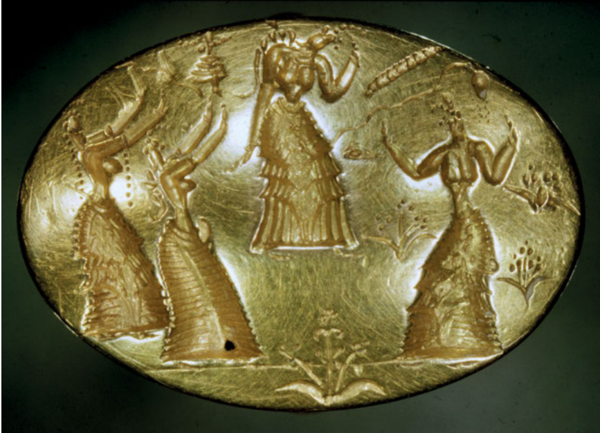
Abb. 1: Minoischer Siegelring aus Isopata (Kreta, 16. Jahrhundert v. Chr.) (© Archäologisches Museum Heraklion, HM 424 – Hellenic Ministry of Culture and Sports – TAP Service).