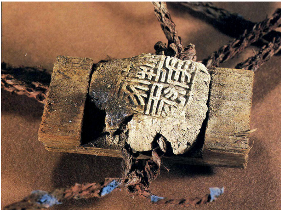
Abb. 3: Amtslehmsiegel aus Mawangdui, Provinz Hunan, 2. Jahrhundert v. Chr. (© Songchang Chen, Changsha).

Die siegelbezogenen Praktiken sind nach funktionalen, technischen oder prozessualen Kriterien zu unterscheiden. Erfüllt das Siegel eine Verschlussfunktion, kann man von versiegeln (verschließen, plombieren ) sprechen. Es kann dabei die betreffenden Objekte vollständig umschließen, wie die frühen Tonbullen im östlichen Mittelmeerraum, oder wie die chinesischen Lehmsiegel Schnüre zum Verschluss permanent fixieren (Abb. 3). Beim Beschluss meint siegeln in erster Linie besiegeln (verbindlich vereinbaren).