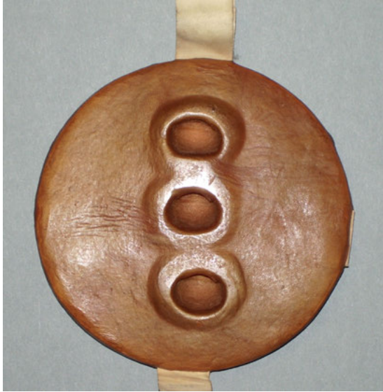
Abb. 7: Drei Daumeneindrücke auf der Rückseite des königlichen Siegels (Ruprecht I., Heidelberg, 9. 5.1408).

Schreiben Jeanne d’Arcs, in dessen Siegel ein Haar der „Jungfrau von Orléans“ eingefügt war – der einzige Nachweis für Jeannes dunkle Haarfarbe. 43