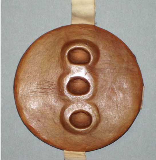
Abb. 7: Drei Daumeneindrücke auf der Rückseite des königlichen Siegels (Ruprecht I., Heidelberg, 9. 5.1408).

Schreiben Jeanne d’Arcs, in dessen Siegel ein Haar der „Jungfrau von Orléans“ eingefügt war – der einzige Nachweis für Jeannes dunkle Haarfarbe. 43