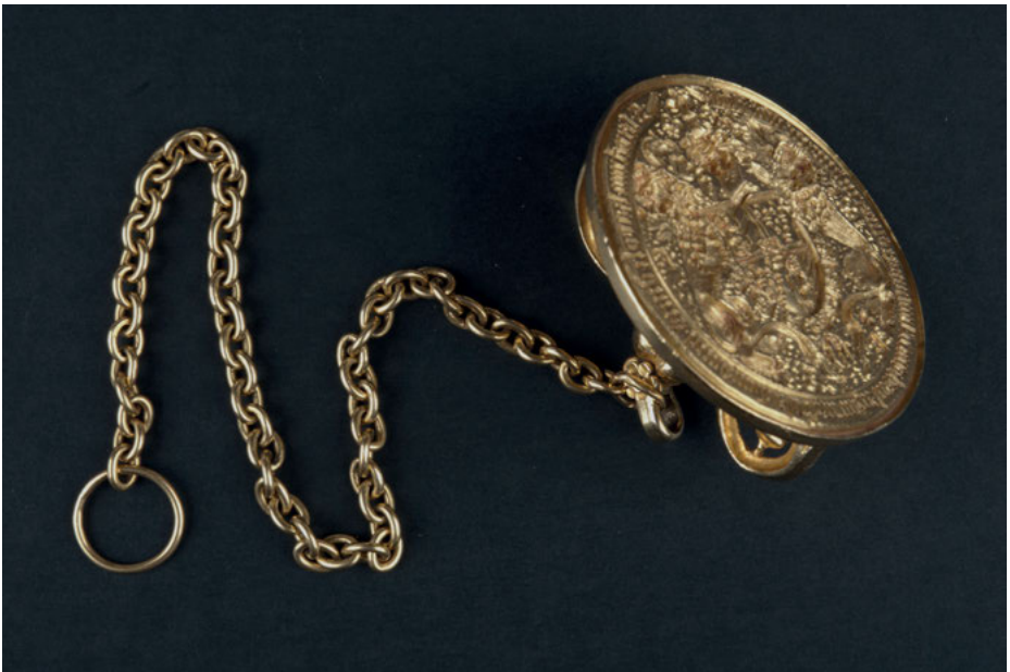
Abb. 2: Sekretsiegel Herzog Karls des Kühnen von Burgund (1468?).