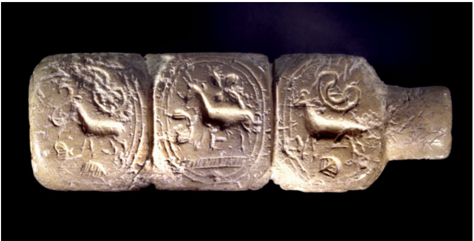
Abb. 5: Typar aus Knochen mit insgesamt 14 Siegelflächen aus der Nekropole von Phourni, Archanes (Kreta, Beginn des 2. Jahrtausends v. Chr.) (© Archäologisches Museum Heraklion, HM 2260 – Hellenic Ministry of Culture and Sports – TAP Service).