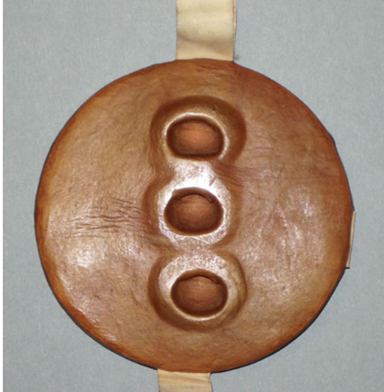
Abb. 7: Drei Daumeneindrücke auf der Rückseite des königlichen Siegels (Ruprecht I., Heidelberg, 9. 5.1408).

Schreiben Jeanne d’Arcs, in dessen Siegel ein Haar der „Jungfrau von Orléans“ eingefügt war – der einzige Nachweis für Jeannes dunkle Haarfarbe. 43