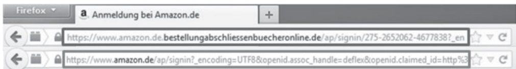
Abbildung 1: Beispiel für original und phishing Version der selben Webseite

Im Awareness-Teil des Trainings werden den Teilnehmern allgemeine Informationen über Phishing vermittelt. Auch wird die Relevanz der URL bei der Identifikation von Phishing Webseiten betont. Dies wird anhand verschiedener Beispiele direkt gezeigt.