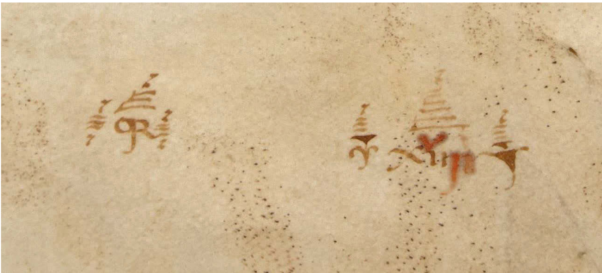
Abb. 2: Burgerbibliothek Bern, Cod. 233, f. 8v.