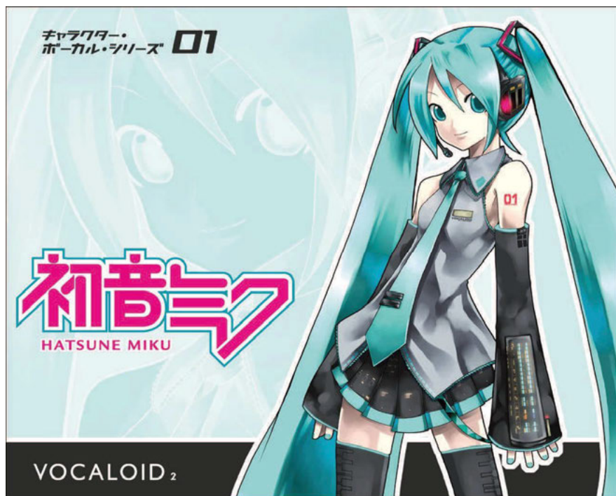
Abb. 1: Vocaloid 2-Software mit Hatsune Miku-Illustrationen; https://matome.naver.jp/odai/2138727630601129501/2142350217692027203 (letzter Zugriff: 21. Januar 2018).