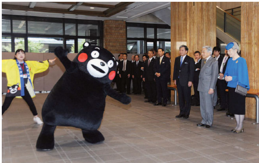
Abb. 2: Eine Kumamon-Aufführungssituation für den (und mit dem) Tennō; http://www.huffingtonpost.jp/2013/10/28/kumamon_n_4168883.html (letzter Zugriff: 7. Juni 2017).

Theresa Schmidtke und Martin Stobbe anhand von Actionfiguren gezeigt haben, ist die „performative Aktualisierung“ (Schmidtke/Stobbe 2014, 89) ein Aspekt der narrativen Partizipation, „der in bisherigen Forschungsbeiträgen zu transmedialen Storyworlds noch kaum beachtet worden ist“ (Schmidtke/Stobbe 2014, 89). Der Einschätzung, dass es sich dabei aber lediglich um „Satelliten“ der jeweiligen Franchises handelt (Schmidtke/Stobbe 2014, 96), sollte – mindestens im japanischen Kontext – skeptisch begegnet werden; schon alleine, da hier vielfach ohnehin nicht (bestimmte) Storyworlds im Vordergrund stehen. Wie Ito Mizuko in vielen Aufsätzen herausgestellt hat, ist es eben diese Instrumentalisierung von alltäglichen Spiel- und Vorstellungspraxen, in der die Besonderheit japanischer media mix -Franchises gesehen werden kann: „mobilizing the imagination in everyday play“ (Ito 2008, 397). Kyara -Produkte dienen damit nicht nur dem intendierten Zweck, als private Imaginationenobjekte zu fungieren. Sie sind sogar „explicitly designed to allow for user-level reshuffling and reenactment“ (Ito 2008, 404).