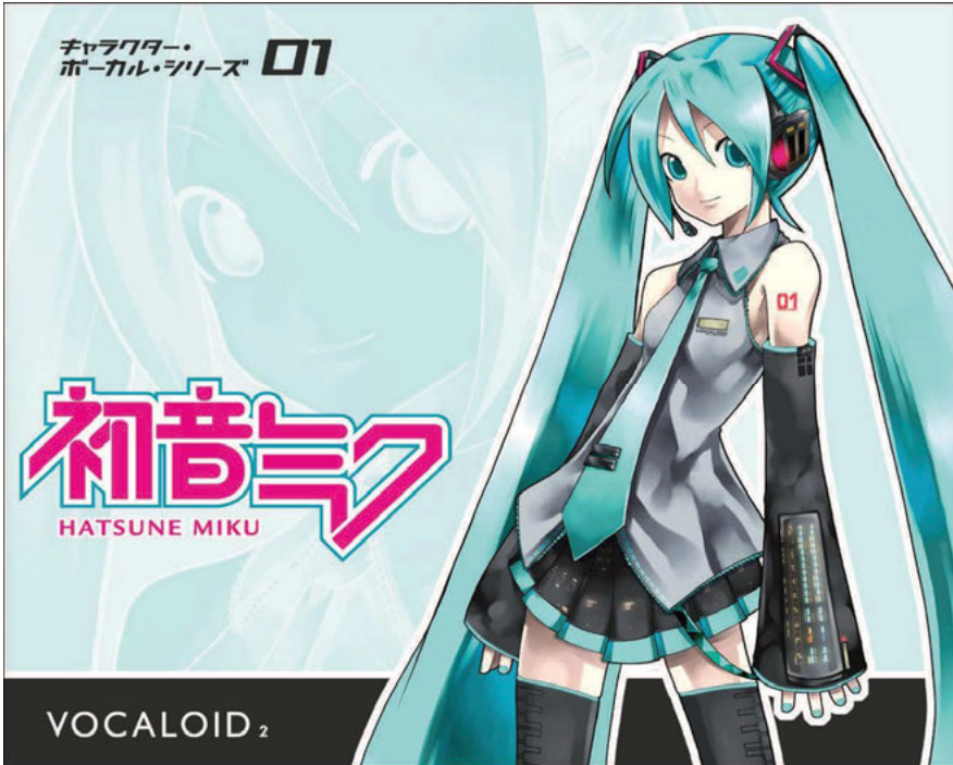
Abb. 1: Vocaloid 2-Software mit Hatsune Miku-Illustrationen; https://matome.naver.jp/odai/2138727630601129501/2142350217692027203 (letzter Zugriff: 21. Januar 2018).