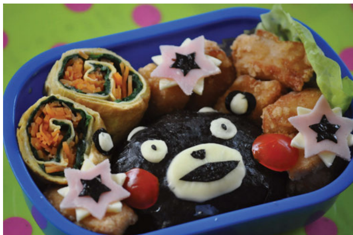
Abb. 4: Einer von unzähligen Blogs, der dem Herstellen von kyaraben , Speisen im ‚Figuren-Look‘ gewidmet ist (hier von Kumamon, dem Maskottchen der Präfektur Kumamoto): http://harry63.exblog.jp/20594052 (letzter Zugriff: 7. Juni 2017).

Ermöglicht wird diese ‚Transferierbarkeit‘ und ‚Identitätspräsenz‘ somit durch die besondere Bildlichkeit des ikonographischen Linienbilds, das (anders als fotografische, malerische oder computergerenderte Bildlichkeit) tatsächlich auch physisch leicht reproduziert – und vermittels aller nur denkbaren Materialitäten imitiert – werden kann (vgl. Wilde 2016). Dies reicht bis zu kyara -Kochrezepten, durch die kyara bentō ( kyaraben , キャラ弁), Speisen im spezifischen ‚ kyara -Look‘, hergestellt und als solche wiedererkannt werden können. Auf Tausenden von Internetseiten und YouTube-Channels lassen sich entsprechende Rezepte finden (vgl. Occhi 2018, siehe Abb. 4). Auch hier ‚gilt‘ jeder zuzō X immer noch als kyara Y.