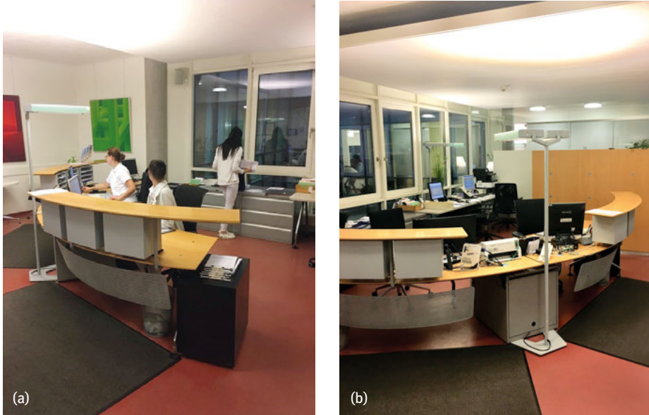
Abb. 4.2: (a) Anmeldung. (b) Arbeitsplatz und Administration.