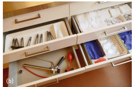
Abb. 4.3: (a) Einrichtung eines Behandlungsraums mit Untersuchungsstuhl. (b) Einteilung der Schränke und Ausstattung der Schubladen.