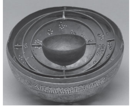
Abb. 3b: Innenaufnahme von Abb. 3a mit kardanischer Aufhängung.

um 180° oder 360° gedreht wird, denn der innerste Ring mit dem Schälchen bleibt stets in der Horizontalen. Von Villard de Honnecourt ist eine Zeichnung dieser – nach Gerolamo Cardano benannten – ‚kardanischen Aufhängung‘ erhalten, 8 und die gewählte Linksneigung für die Darstellung der zwei von Engeln durch die Luft geschwenkten Weihrauchfässer zeigt, dass auch der Maler des Retabels aus Pian di Mugnone bewusst den problematischen Moment des Gebrauchs eines Weihrauchfasses, nämlich den der Schwingung, ins Bild setzte.