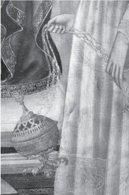
Abb. 1: Toskanischer Künstler, Maria mit Kind und Heiligen, Detail eines Weihrauchgefäßes, um 1320, Florenz, Galleria degli Uffizi.