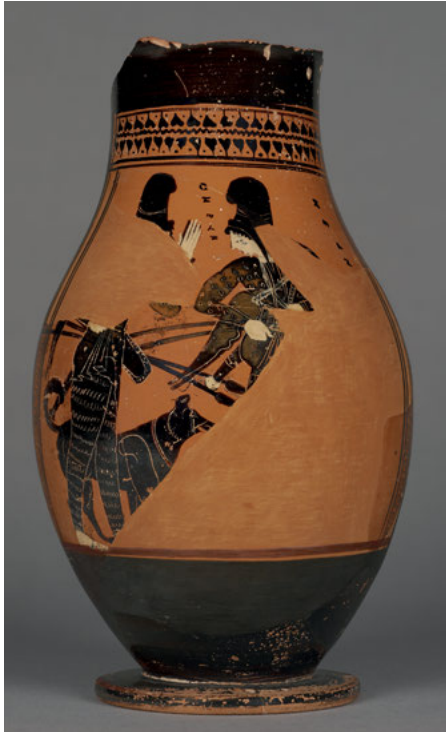
Abb. 11: Athen, der Leagros-Gruppe zugeschriebene, schwarzfigurige Olpe, 525-510 v. Chr., Malibu, J. Paul Getty Museum, Villa Collection.

und an andere am Schwarzen Meer, im kaukasischen, iranischen und zentralasiatischen Raum verbreitete Sprachen ausmachen. Geschrieben sind diese Sprachzeugnisse, welche häufig bereits durch ihre Kleidung als Nicht-Griechen identifizierbare Figuren flankieren, auf den Vasen allerdings stets in griechischer Schrift.