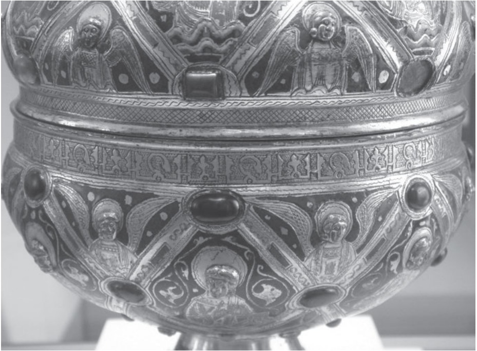
Abb. 4: Meister Alpais, Detail eines Ziboriums, Limoges, 12. Jahrhundert, Paris, Musée du Louvre.

Und so lässt sich das Retabel aus Pian di Mugnone ebenfalls im Kontext dynamischer Interrelationen zwischen visueller und materieller Kultur, künstlerischer Transferprozesse und Bild-Ding-Schrift-Verschränkungen in transkultureller Perspektive beschreiben.