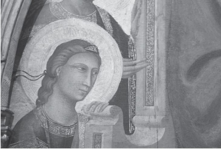
Abb. 9a: Detail von Abb. 2.