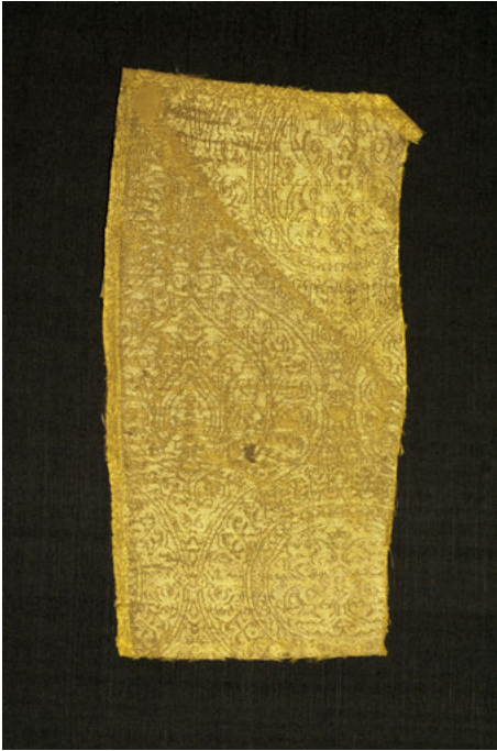
Abb. 10: Syrien oder Byzanz, Fragment eines goldgelben ‚geritzten‘ Seidengewebes, 11. oder 12. Jahrhundert, Berlin, Kunstgewerbemuseum.

ihr Muster dann „wie in blankes Metall eingraviert“ beschrieben und bis heute fungiert die Bezeichnung „sogenannte geritzte Seiden“ als Fachbegriff dieser Stoffart. 32