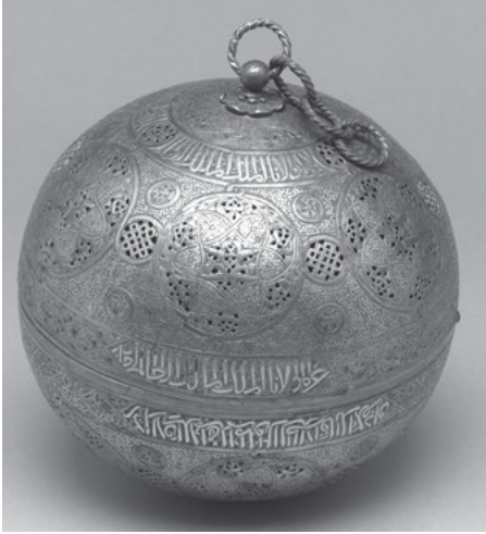
Abb. 3a: Wahrscheinlich Syrien (Damaskus), metalltauschierte Räucherkugel, spätes 13., frühes 14. Jahrhundert, New York, Metropolitan Museum of Art.