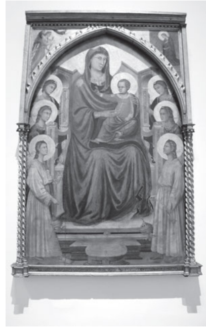
Abb. 2: Toskanischer Künstler, Maria mit Kind und Heiligen, um 1320, Florenz, Galleria degli Uffizi.

Die Räuchergeräte sind in nächster Nähe zum Betrachter dargestellt, zudem in einer Größe, die erhaltenen Exemplaren entspricht. 3 An der Schwelle zwischen Bild- und Betrachtterraum platziert, verweisen die Weihrauch schwenkenden Engel auf die in der Kirche wirkenden Thuriferare sowie auf den Gebrauch von thuribula bei Prozessionen und vor dem Altar. Zwar legt der Umstand, dass Beda Venerabilis (†753), Honorius von Autun (†1155), Sicardus (†1215) und Durandus (†1296) Rauchfässer symbolisch als Leib Christi deuteten, 4 nahe, dass sich die semantischen Dimensionen dieser Bildfindung – gerade in Anbetracht der Darstellung des segnenden Christusknaben – nicht auf die Realienkunde beschränkten. Doch lenken die detaillierte Gestaltung und die gewählte Positionierung der Weihrauchfässer den Betrachter immer wieder auf die Dinglichkeit der dargestellten Artefakte selbst.