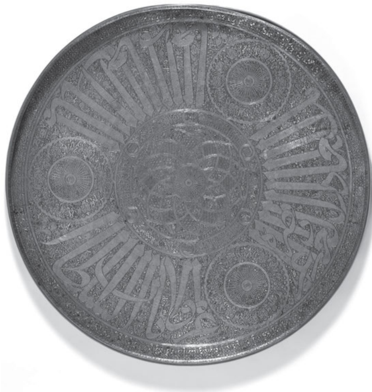
Abb. 9b: Ägypten oder Syrien, tauschiertes Metalltablett, 1330-1360, London, Victoria and Albert Museum.