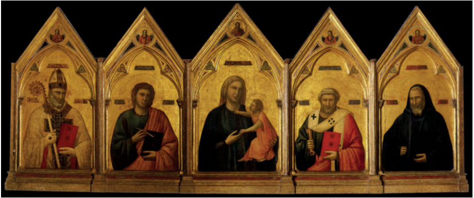
Abb. 5: Giotto di Bondone, Badia-Polyptychon, 1295-1300, Florenz, Galleria degli Uffizi.