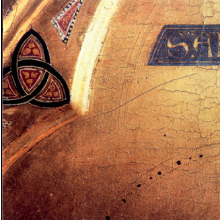
Abb. 6: Detail von Abb. 5.