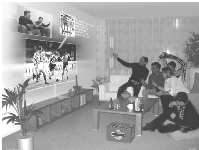
Abb. 2: Die banale Realität der Philips-Vision: Eine allgegenwärtige Medienwelt.

Trotz der erwähnten Unterschiede gibt es in den programmatischen Papieren von Aarts oder der ISTAG keine klare Abgrenzung zu den Begriffen Ubiquitous und Pervasive Computing. Ein gewisser Unterschied dürfte aber die Tatsache sein, dass das Interaktions- oder Nutzungsparadigma (eben nicht nur »Computing« oder »Communication«) bei Ambient Intelligence nicht festgelegt ist. Grob gesprochen ist das Aufgabengebiet durch die intelligente Interaktion von Benutzern mit der jeweiligen Umgebung charakterisiert. Im Vordergrund steht dabei die Intelligenz, die sich in den von dem Anwender verwendeten Zugangsgaräten, in einem Netzwerk, in den zugegriffenen Medien/Informationen oder der Umgebung manifestieren kann.