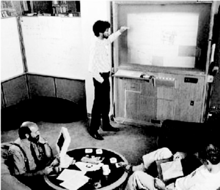
Abb. 1: Ubiquitous Computing-Installation bei Xerox PARC mit LiveBoard und ParcPad (vorne rechts). Mark Weiser ist ganz links zu sehen.

All dies führte 1988 zu einer radikalen Kritik an dem am PARC selbst entwickelten und mittlerweile paradigmatischen Leitbild des »Personal Computing«: 3