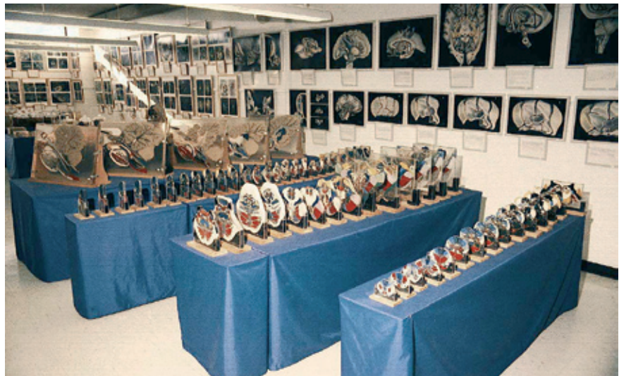
Abb. 3.: Blick in die von Philipp Schwartz zu Lehrzwecken konzipierte Ausstellung „The Transparent Brain“, ausgestellt in Miami Beach, Florida, 1960.

Neben Geburtstrauma, Schlaganfall, Tumorphathologie und Tuberkulose trat mit den Altersveränderungen des Gehirns zudem ein weiteres neuropathologisches Gebiet, auf dem er 1967, im Alter von 75 Jahren, die Leitung einer eigens eingerichteten Forschungsanstalt für Geriatrie erhielt,