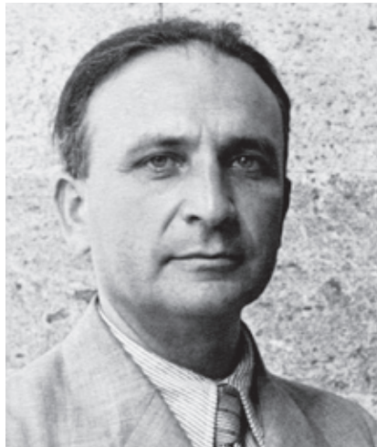
Abb. 1.: Philipp Schwartz, Mitte der 1930er Jahre.

Geboren wurde Schwartz am 19. Juli 1894 in Werschetz im Banat. Diese Region erfuhr 1918 eine Dreiteilung und gehört heute zu Rumänien, Ungarn und Serbien. Historisch handelte es sich um einen jener südosteuropäischen Vielvölkerstaaten en miniature , dessen alltagsgeschichtlich gewachsenes Miteinander verschiedensprachiger Volksgruppen im Rückblick auf die ethnischen Säuberungen des 20. Jahrhunderts geradezu modellhafte Züge angenommen hatte. Seit Österreichs Niederlage gegen Preußen im Jahre 1866 erfuhr das österreichisch-ungarische Banat bereits eine rücksichtslose ungarische Nationalisierungspolitik, deren grassierender Antisemitismus viele Angehörige der jüdischen Volksgruppe nach Deutschland trieb, wo die Juden im 19. Jahrhundert einen – trotz Ambivalenzen