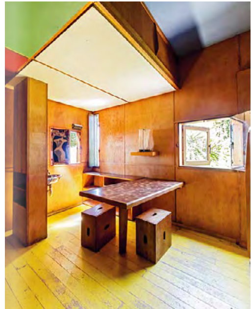
Innenansicht des Cabanon