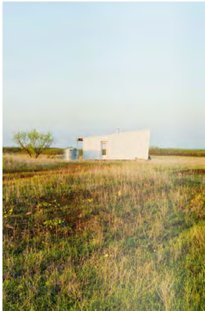
Blick nach Nordosten, Sustainable Cabin