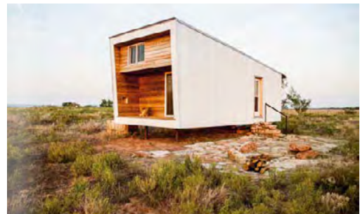
Blick nach Nordwesten, Sustainable Cabin