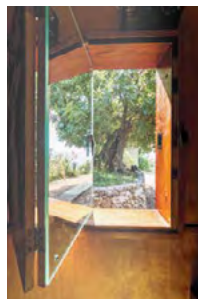
Fenster nach Südosten mit verspiegeltem Fensterladen, Le Cabanon