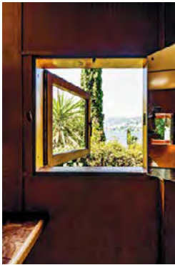
Fenster nach Südwesten mit verspiegeltem Fensterladen, Le Cabanon